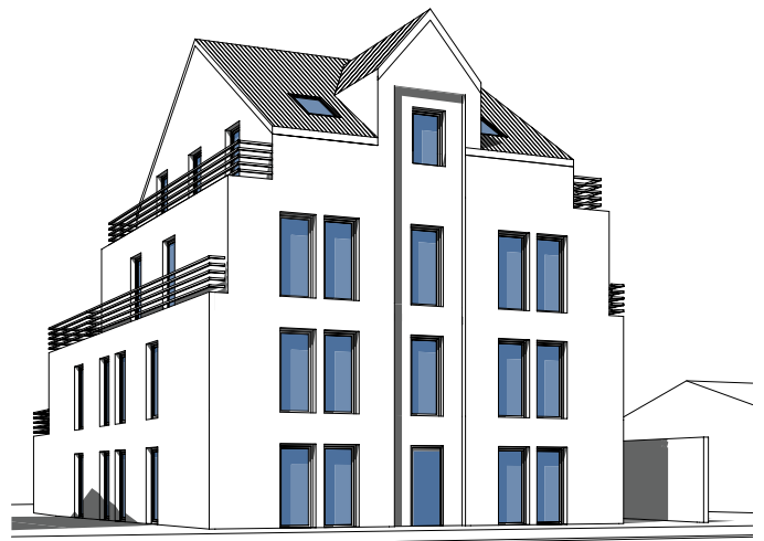
Nordansicht Fassade zur Steinmetzstraße

Ein exklusives Wohnprojekt entsteht direkt am wunderschönen Stadtpark von Bottrop. Das Mehrfamilienhaus ist ideal für Menschen, die gern nah an der Natur leben, aber nicht auf urbane Strukturen verzichten möchten. Perfekt für alle, die das Besondere wollen.